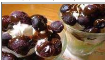
ブルーベリーパフェ