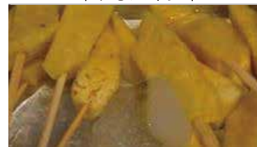
冷やしパイナップル