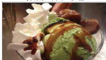
抹茶アイスパフェ