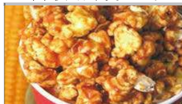
キャラメルポップコーン