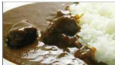
欧風ビーフカレー