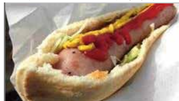
ソーセージ・ピタドッグ