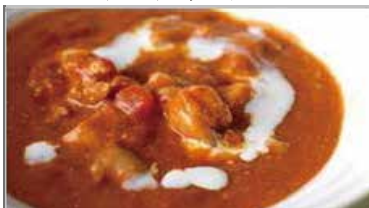
バターチキンカレー